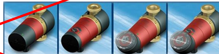
UP 20-14 BX