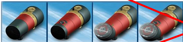
UP 15-14 B

Predaj starších verzií čerpadiel COMFORT bol ukončený a na trh ich už nedodávame.