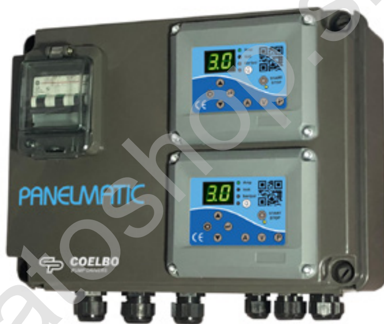
Panelmatic Easy M - Panelmatic Uno M - Panelmatic Duo M Panelmatic Easy T - Panelmatic Uno T - Panelmatic Duo T

Táto rodina elektronických panelov si osvojuje filozofiu jednoduchšej konfigurácie pre koncového užívateľa, ktorá bola predtým aplikovaná na naše meniče. Pomocou 5 preddefinovaných prevádzkových režimov je možné riadiť akúkoľvek aplikáciu tlakovania, odvodňovania, plnenia alebo zavlažovania. Pripojenie ovládacích prvkov - sond, tlakových spínačov, prevodníkov alebo hladinových spínačov - je jednoduché a intuitívne.